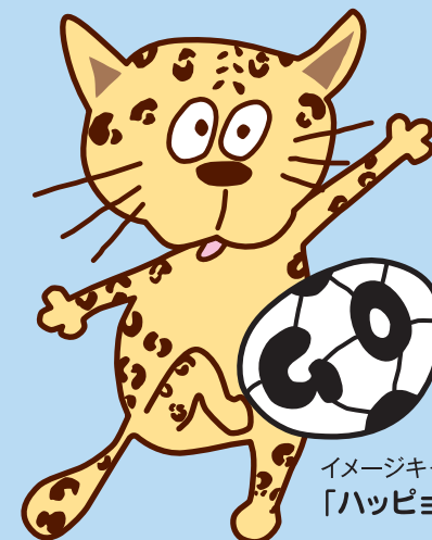
イメージキャラクター 「ハッピーウ」

兵庫自治研は、こうした情勢下、行政や公共サービスのあり方、コミュニティづくりや公共サービス労働者の役割と働き方などを、災害対策、脱原発を交え討議します。17年前、大災害と多くの支援を受けた地で。