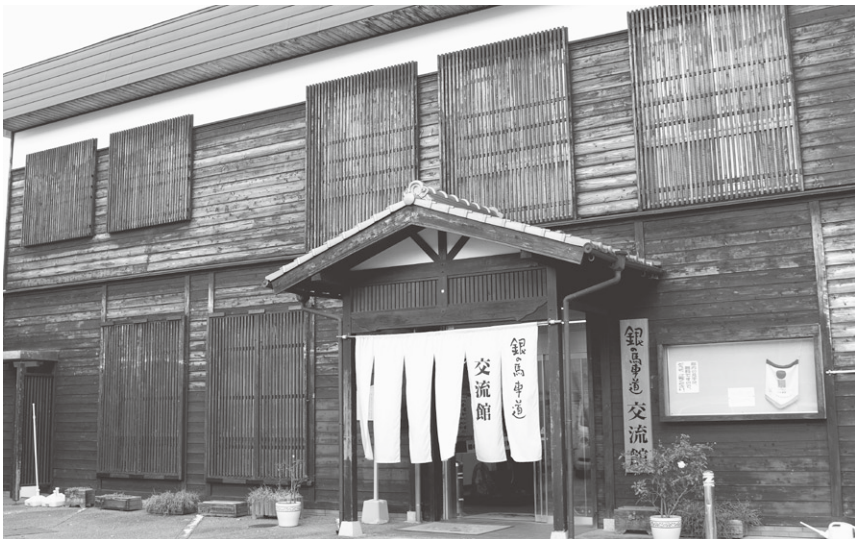
但陽信用金庫支店を改装して「銀の馬車道交流館」に