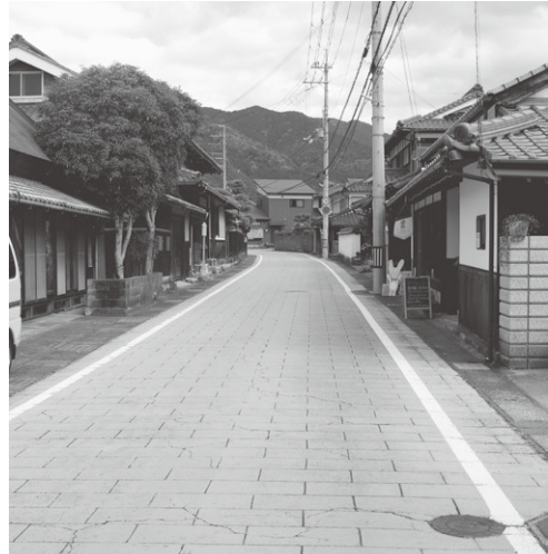
交流館の展示内容 古い街並が残る栗賀町

遺産に認定された。2017年には、馬車道跡に残る景観が評価され日本遺産に認定された。