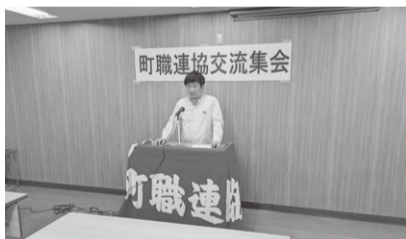
司会を務める国広事務局長